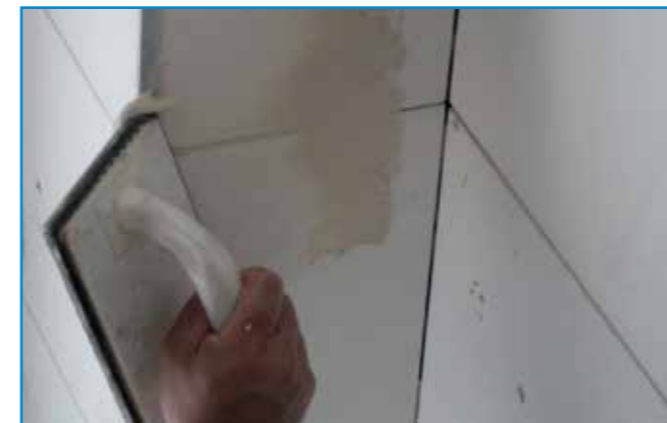
A csatlakozó profilok mentén is használjunk fugázóanyagot!