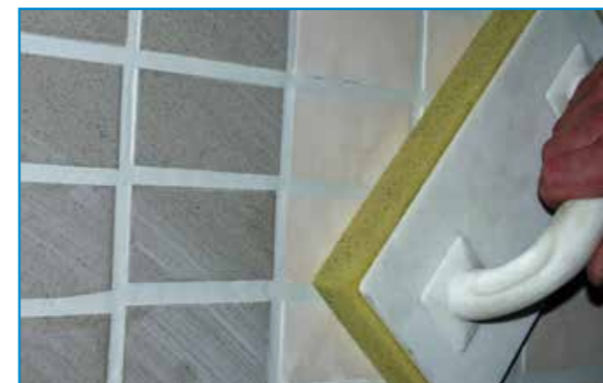
A lemosószivacsot enyhe nyomással húzzuk végig a felületen. A lemosást csak tiszta vízzel szabad végezni.