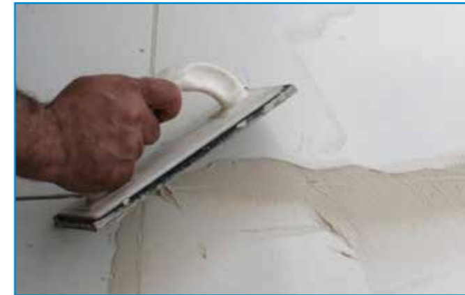
A fugázóanyagot a burkolólapok átlójának irányában hordjuk fel.

Bedolgozhatósági idő: Az anyag a bekeverés befejezésétől kb. ennyi ideig használható fel (átkeverés szükséges lehet)